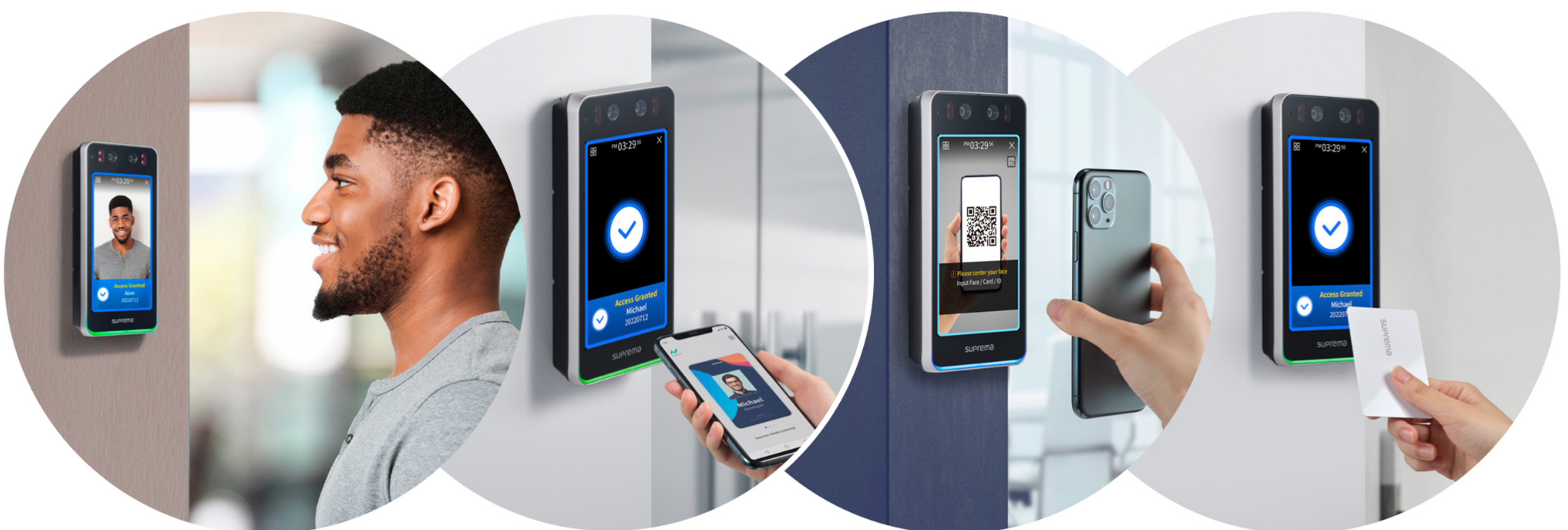
การยืนยันตัวตนด้วยใบหน้า

BioStation 3 มอบตัวเลือกข้อมูลรับรองที่หลากหลาย เลือกใช้วิธีการยืนยันตัวตนที่สะดวกที่สุด ซึ่งทั้งหมดเป็นแบบไร้การสัมผัสและเข้ากันได้อย่างลงตัวกับโลกหลังยุคโรคระบาด